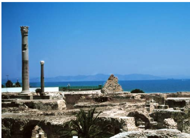
Karthago var romarrikets tredje största stad. I dag finns ruinerna kvar, med amfiteater och ett romerskt bad.

Svenska researrangörer har utfärder hit. På egen hand kan du ta tåg från Tunis.