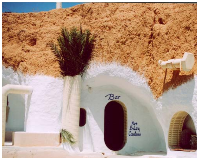
Grotthotellet i Matmata – här finns rester från baren i filmen Star Wars.

Dar Cheraiet i Tozeur är ett bergarhem som det såg ut på 1800-