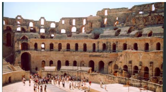
Den romerska amfiteatern i El Jem.

talet. Ett orientalistiskt palats med två restauranger för den som vill njuta av arabisk arkitektur och förstaklassmat. Gratis inträde.