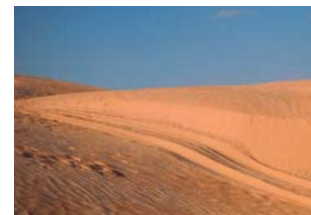
Sanddyner i öknen.

Monty Python-gängets film spelades bland annat in i en arabisk fästning från 700-talet, Ribat Harthema, som ligger strax utanför Sousse.