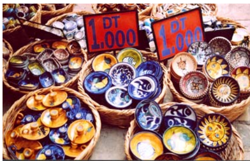
På många ställen ska du pruta. På andra är det fasta priser.

Skandinaver är oftast ovana vid prutning. En god regel är att en säljare endast säljer om han är nöjd med priset så var