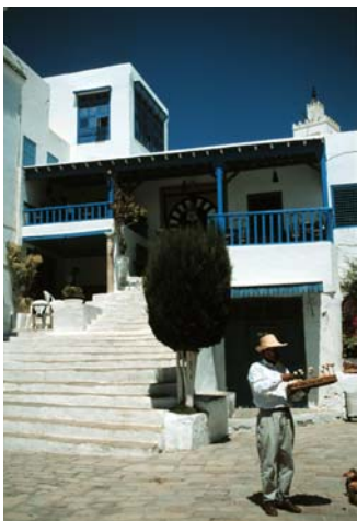
Sidi Bou Said – pittoresk plats strax utanför Tunis.