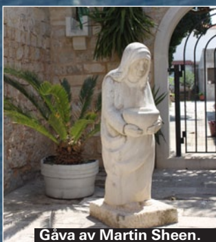
Gåva av Martin Sheen.

Brac blev känt under romartiden då sten från ön bröts för att bygga Diocletianus palats i Split. Än i dag bryts sten här, till byggen och skulpturer. Öns klimat gjorde också att olivodlingar startades tidigt. Ön har styrts av romare, venetianare, ungre och har kyrkor och grottor från olika tidsperioder.