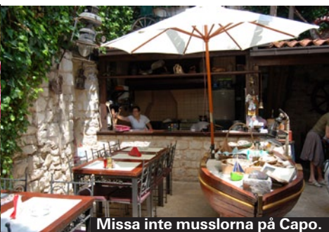
Missa inte musslorna på Capo.