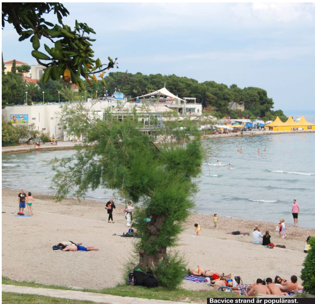
Bacvice strand är populärast.