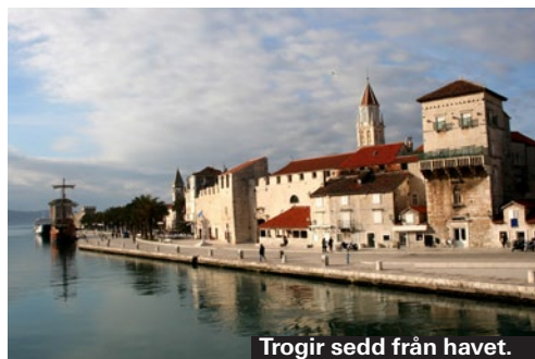
Trogir sedd från havet.

Sveti Dominik ligger i det gamla dominikanerklostret från 1200-talet vid strandpromenaden. Här serveras färsk fisk och skaldjur, även bra pasta och pizza. En måltid för två kostar från 200 kronor. Kvällstid är Dominik ett populärt ställe för cocktails. ► www.svdominik.com