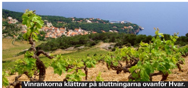
Vinrankorna klättrar på sluttningarna ovanför Hvar.

Det går båtar från hamnen i Hvar stad till öar och badstränder. Ta båten till Pelikiniöarna eller hyr en egen båt för en heldag. Missa inte stränderna på Sveti Kliment, Karolim och Marinkovac'.