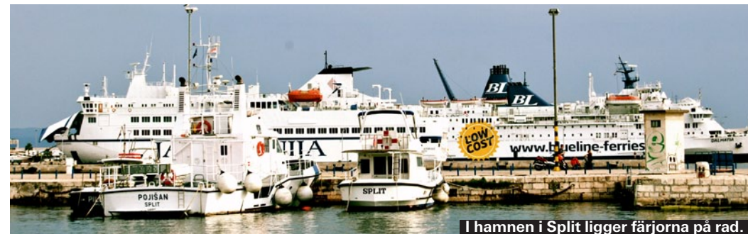
I hamnen i Split ligger färjorna på rad.