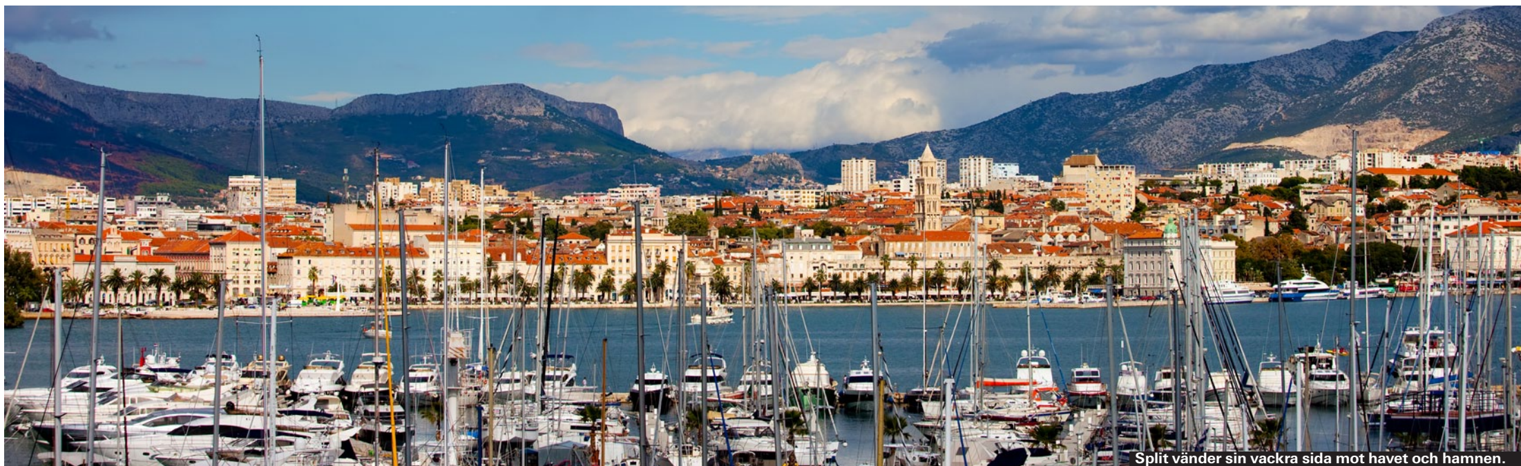
Split vänder sin vackra sida mot havet och hamnen.