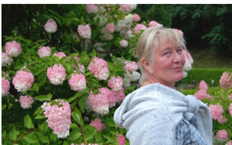
Text & foto: KATARINA ARVIDSON

Dobro došli o Hrvatsko! Välkommen till Kroatien!