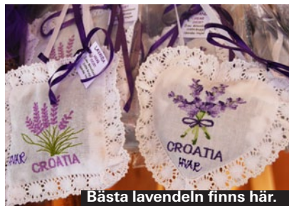
Bästa lavendeln finns här.