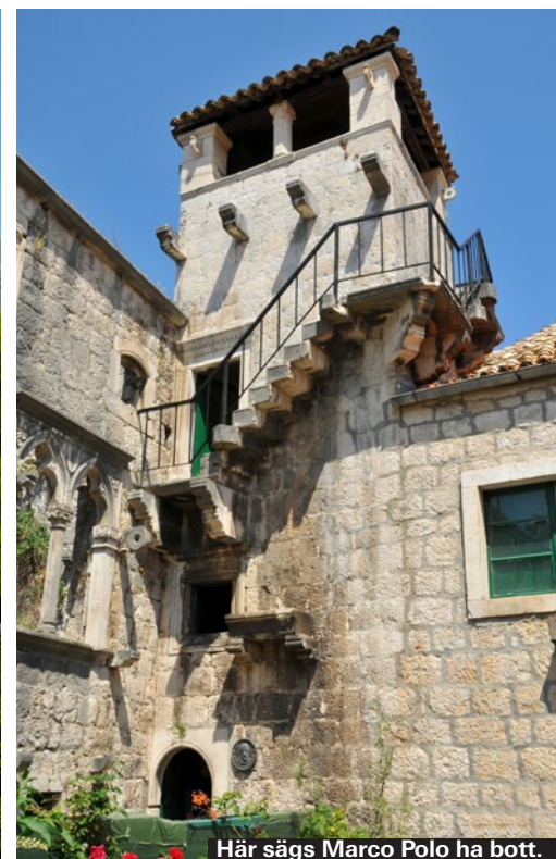
Här sägs Marco Polo ha bott.