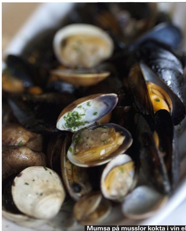
Mumsa på musslor kokta i vin eller nyfångad bläckfisk i en fräsch sallad.