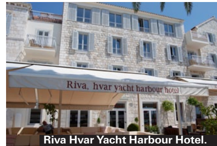
Riva Hvar Yacht Harbour Hotel.

På butiken Konzum hittar du livets förnödenheter. Bröd, pålägg, godis och drycker. Ligger vid stora torget och har öppet varje dag kl 8-14 och 16-20.