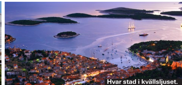
Hvar stad i kvällsljuset.