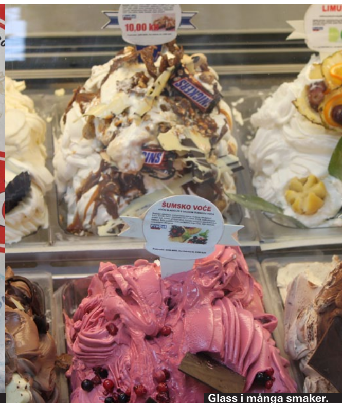
Glass i många smaker.