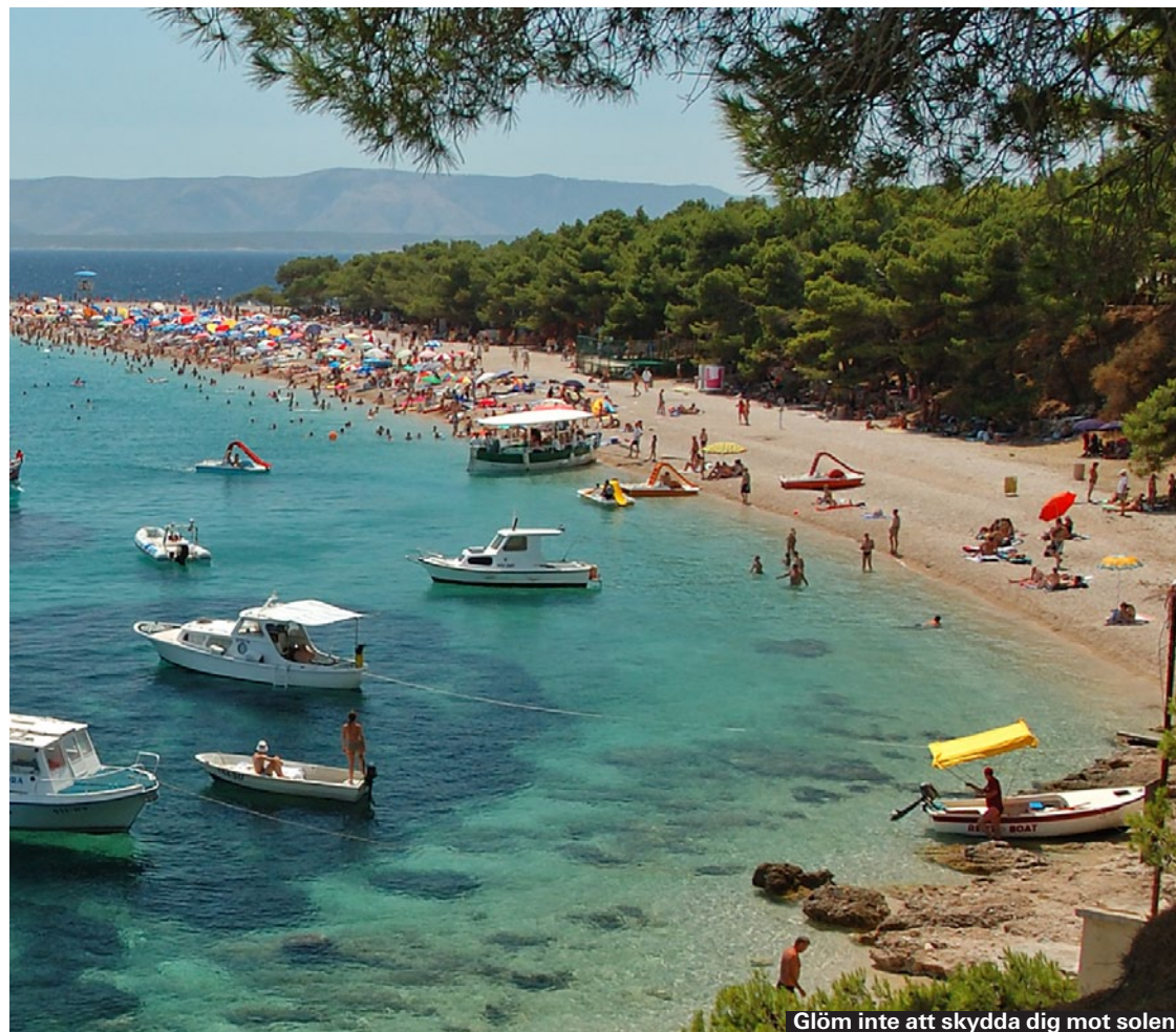
Glöm inte att skydda dig mot solen.