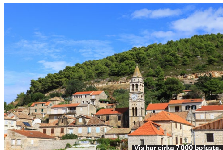
Vis har cirka 7 000 bofasta.