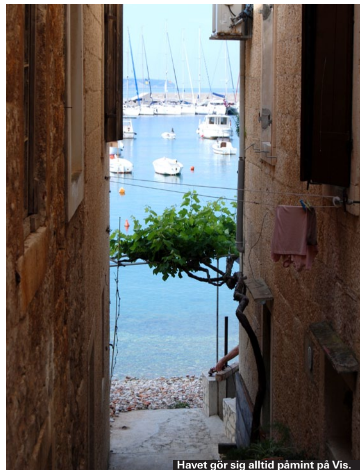
Havet gör sig alltid påmint på Vis.

Vis ö användes länge av jugoslaviska armén. Under inbördeskriget lades minor ut, så gå inte utanför promenadstråk eller vandringsleder. Förr fanns det varningsskyltar i hamnen men de har tagits bort efter kritik att de skrämmer bort turister.