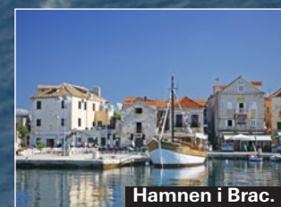
Hamnen i Brac.

På cocktailbaren Bolero i Bol, på väg mot stranden Zlatni Rat, spelas hissmusik blandad med elektronisk musik i lugnt temp.