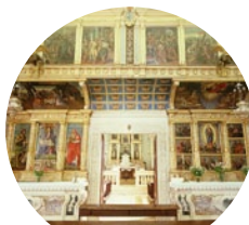
Inga shorts i kyrkan.

och speciellt på söndagar blir du stoppad från besök om du inte är anständigt klädd. Inga shorts och inga linnen.