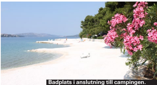
Badplats i anslutning till campingen.