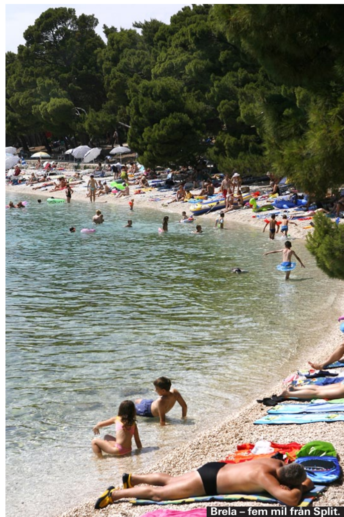
Brela – fem mil från Split.